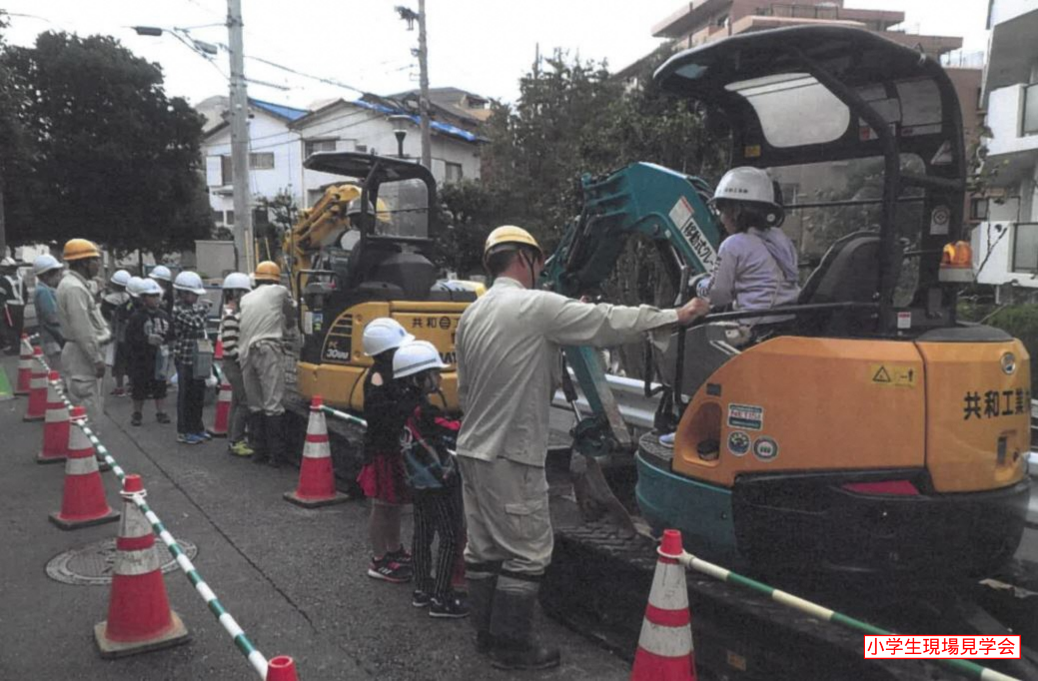
小学生現場見学会