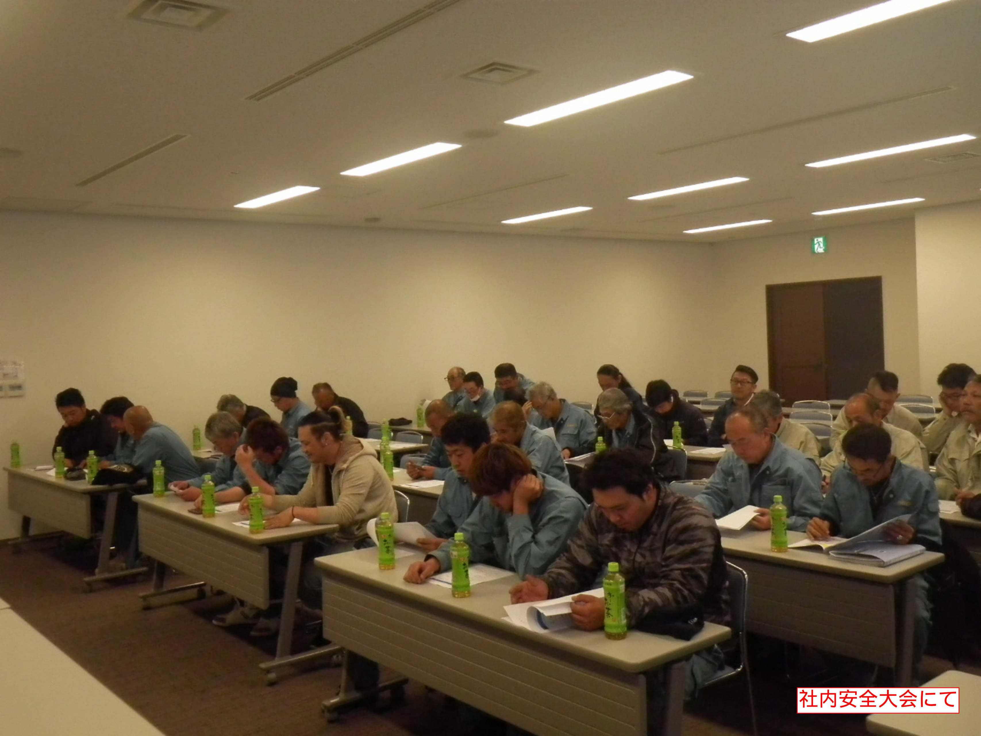
社内安全大会にて